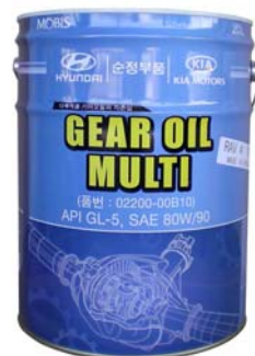
20 л - 02200-00B10

Всесезонное трансмиссионное масло для использования в широком ряде механизмов с прямозубыми, косозубыми и коническими шестернями, совместимо со всеми материалами уплотнений и эластомерными материалами, а также с металлами и сплавами, используемыми в трансмиссиях автомобилей Hyundai и Kia. Создано из минеральных масел высшей очистки, с использованием самых современных противоизносных, антифрикционных, антиокислительных, антипенных и других присадок. Специально подобранные компоненты обеспечивают легкое переключение передач трансмиссии и одновременно гарантируют высокую защиту от износа для шестерен и подшипников. Не образует пену и эмульсии, обеспечивает постоянную смазку и максимальный отвод тепла. Превосходные пластические свойства обеспечивают смазывание при больших удельных давлениях. Превосходная защита от износа, гарантирующая длительную живучесть частей (зубчатые колёса, подшипники, валы, переключатели, и т. п.). Особые вязкостно-температурные свойства этого масла позволяют использовать его всесезонно в широком интервале температур и обеспечивают текучесть при низких температурах. Высокий показатель вязкости гарантирует плавную работу элементов трансмиссии при любых температурах эксплуатации.