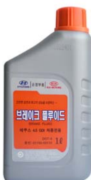
1 л - 01100-00110

Тормозная жидкость уровня качества DOT-4 для тормозных систем автомобилей Hyundai, KIA концерна Hyundai Motor Company (HMC).