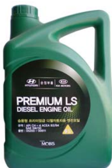
6 л – 05200-00611