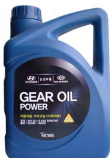
4 л - 02200-00420

Изготовлено на основе высокоочищенного минерального базового масла с добавлением комплекса специальных EP (Extreme Pressure) присадок. Надёжно защищает коробку передач и узлы трансмиссии легковых и грузовых автомобилей, внедорожной и специальной техники при экстремально тяжёлых условиях эксплуатации, включая эксплуатацию автотранспорта в условиях открытых карьеров. Обеспечивает долговременную защиту агрегатов строительной и грузовой техники в условиях высоких переменных нагрузок. Предназначено для современных коробок