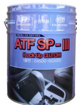
20 л - 04500-00A00