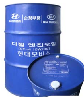
200 л - 05200-00C10