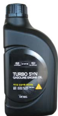
1 л - 05100-00141