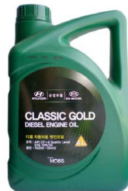
4 л - 05200-00410